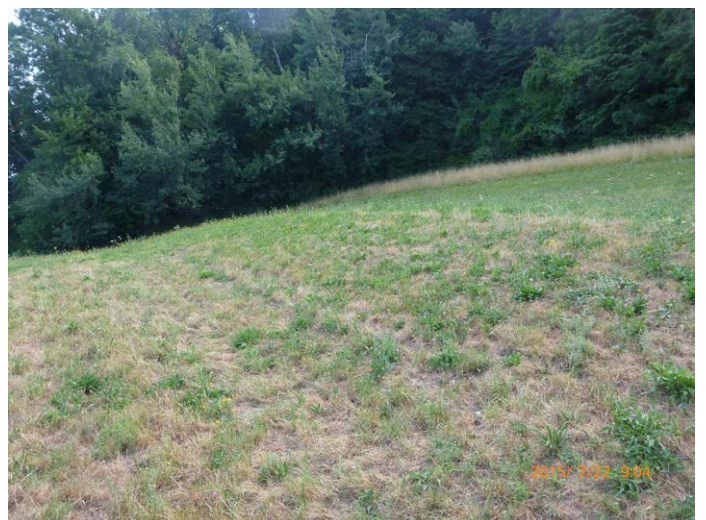
Photos de l'objet 22.07.2015